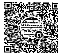
QR Code ไลน์กลุ่ม “ติดตามเด็กออกกลางคัน สนม.”