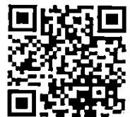
QR Code สิ่งที่ส่งมาด้วย ๑ - ๔